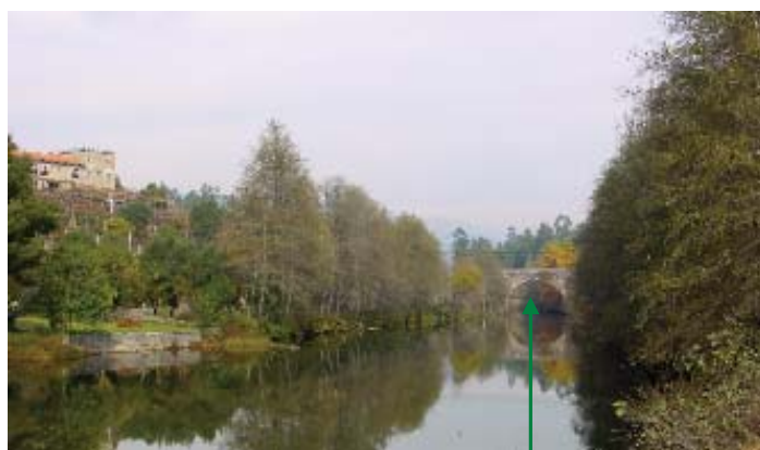
1. Vista para montante. Ponte do período medieval - Monumento Nacional