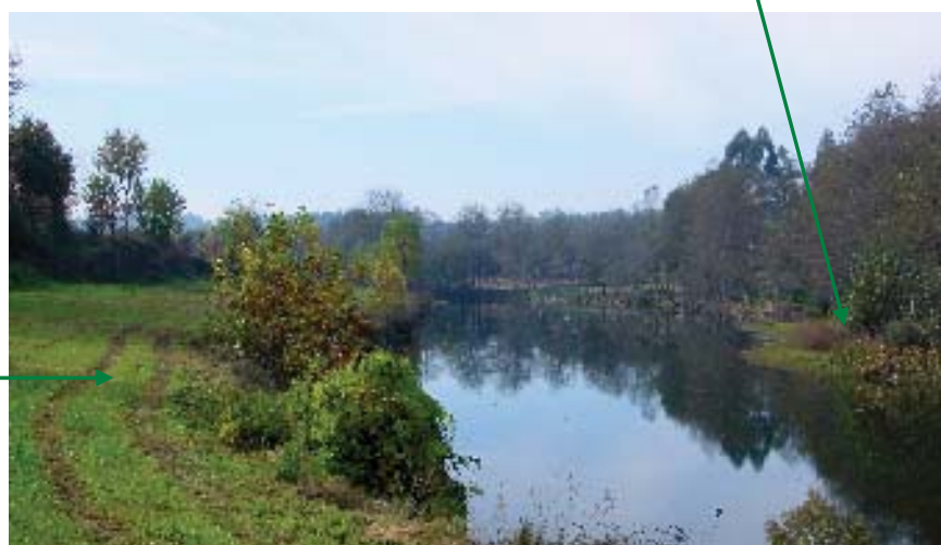
4. Não há recomendações ou propostas para este local.