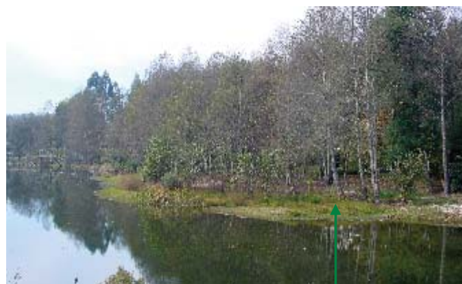
2. Margem direita (sem acesso público): terrenos privados bem conservados – arvoredo e jardins.