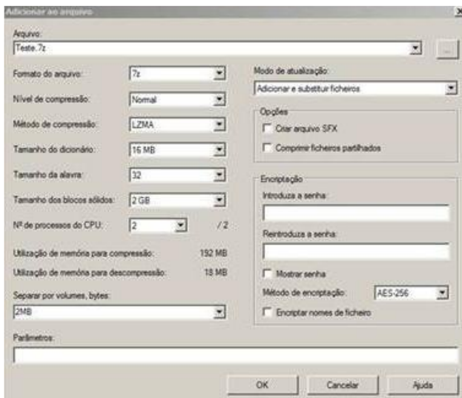
Figura 18 - Exemplo de utilitário de Compressão

Os ficheiros com tamanho superior a 10Mb poderão ser divididos através de um utilitário de compressão (por exemplo o 7zip, mas existem muitos outros utilitários disponíveis) conforme imagem abaixo. Este exemplo é para separar em ficheiros com máximo de 2MB.